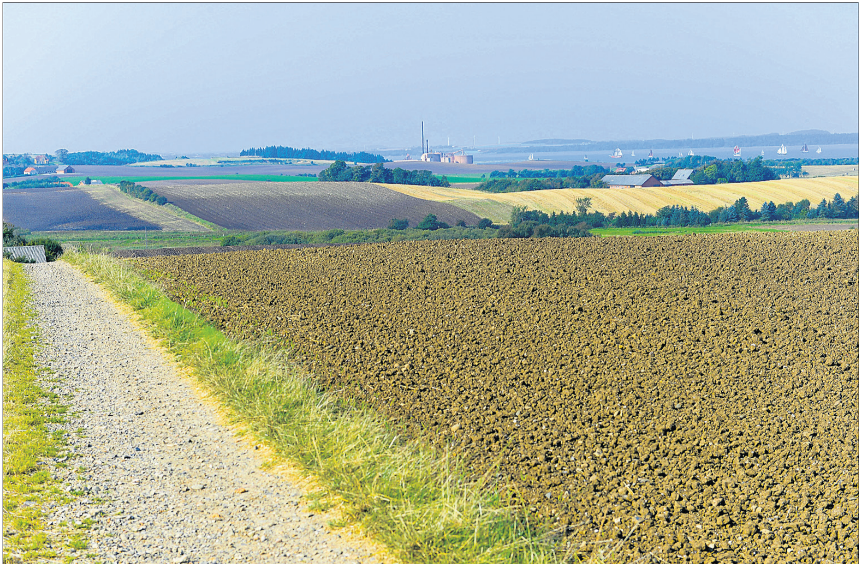
Den gule stubmark og gården i baggrunden er Vangsgård, hvor der nu er fastslået et stort molerfund. I midten ses Damolins molerfabrik få kilometer fra gården.