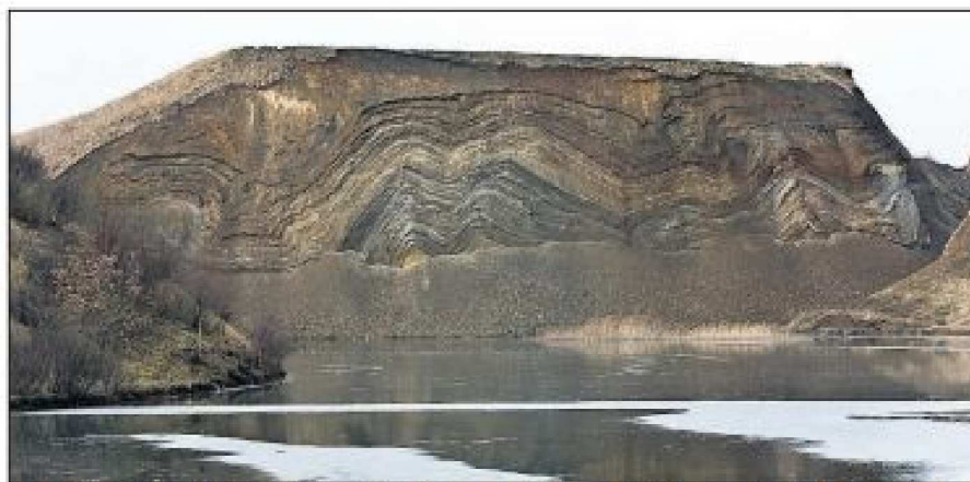
Damolin og Skamol har holdt deres del af aftalen - og det har amt/region også indtil nu. Blandt andet har virksomhederne stået for retableringen af gamle molergrave som bl.a. Ejerslev Havn.

gruppens arbejde er, at man er nået frem til et resultat, der giver molerproducenterne en ret til at indvinde moler efter de skitserede grave- og efterbehandlingsplaner i en periode på ca. 50 år, mod til gengæld at forpligte sig til ikke at indvinde på visse i beretningen nærmere angivne arealer. Dette har molerproducenterne accepteret, uanset der principielt er ret til indvinding af moler efter råstoflovens § 5 på disse arealer".