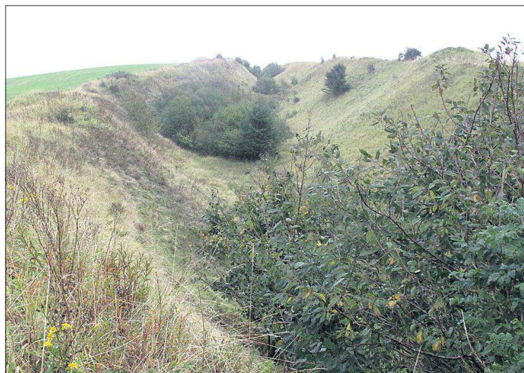
Der har for årtier tilbage været gravet moler i Stærhøj. Det efterladte brud vil Imerys grave videre i og udvide, hvis tilladelsen gives. Indsigelserne mod kommuneplantillægget skal senere behandles i Morsø Kommunes udvalg for teknik og miljø og i kommunalbestyrelsen.