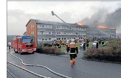
Brande ødelagde 12 lejligheder totalt.

80 beboere blev evakueret, og 12 lejligheder blev så ødelagte, at beboerne ikke kunne vende tilbage. De er efterfølgende blevet genhuset.