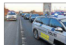
Et uheld på motorvejen ved Svenstrup var medvirkende til lange køer onsdag eftermiddag.

Kun tre minutter efter uheldet i nordgående retning på E45 kørte tre biler