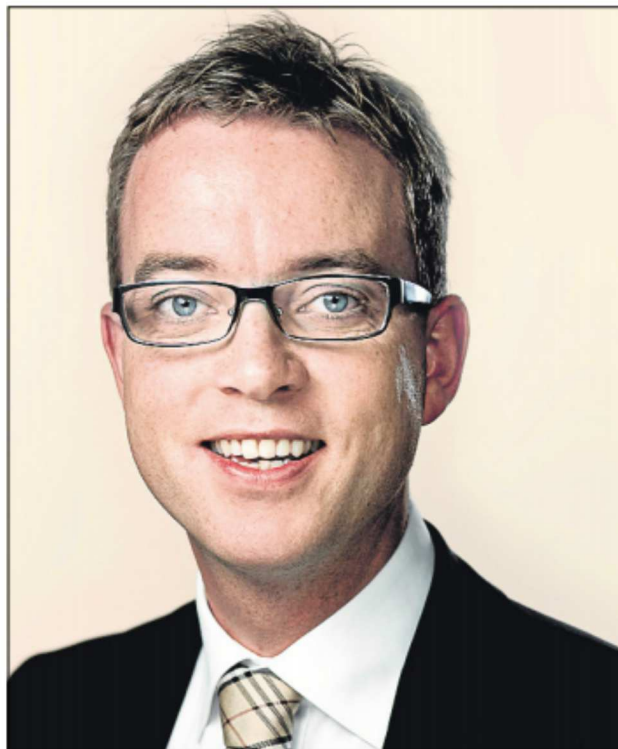
Miljø- og fødevarerminister Esben Lunde Larsen (V) skal forklare statens interesser.

nen i det forslag til råstofplan, der i foråret var ude i offentlig høring, havde taget to omdiskuterede områder ud. Det var arealer ved Mosebjerget og Stærhøj på Mors. I sin indsigelse skriver Styrelsen for Vand- og Naturforvaltning, at den anser det for problematisk, at de to area-