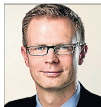
Af Benny Engelbrecht MF og finansordfører for Socialdemokratiet, Egevej 7, Adsbøl, 6300 Gråsten

ALMENE BOLIGER: I torsdags (1.6.) indgik regeringen en aftale med kommunerne om økonomien for 2018. Og vi i Socialdemokratiet kunne drage et lettelsens suk, fordi regeringen heldigvis var kommet på lidt bedre tanker om almene boliger.